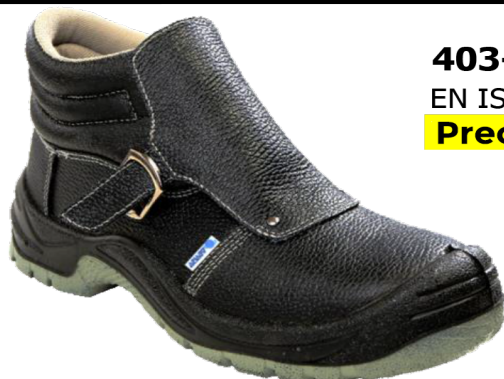
403-0 S3 SRC EN ISO 20345:2011 Precio: 16,80€