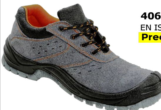
406-0 S1P SRC EN ISO 20345:2011 Precio: 15,90€