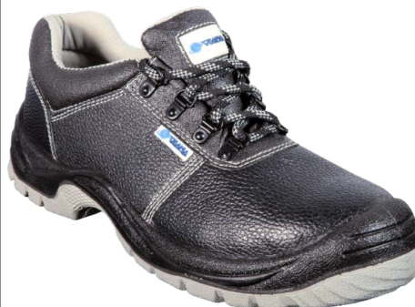
407-2 S3 SRC EN ISO 20345:2011 Precio: 13,15€