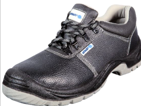
411-0 S1P SRC EN ISO 20345:2011 Precio: 12,80€