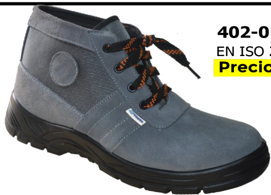
402-0 S1P SRC EN ISO 20345:2011 Precio: 12,00€