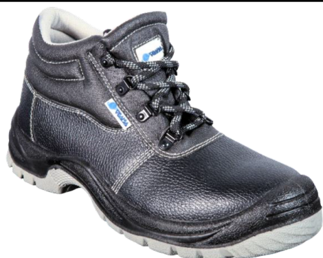
408-0 S1P SRC EN ISO 20345:2011 Precio: 12,80€