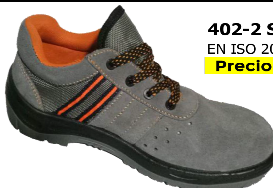
402-2 S1P SRC EN ISO 20345:2011 Precio: 13,10€