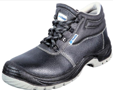
407-0 S3 SRC EN ISO 20345:2011 Precio: 13,15€